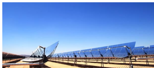
源和电站的槽式太阳能热发电系统