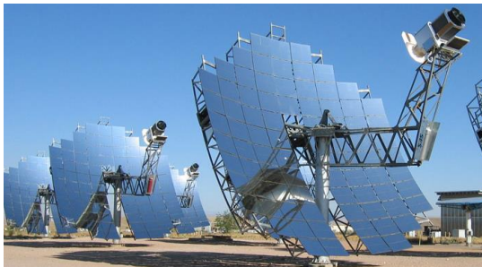
美国斯特林能源的碟式太阳能电站

联系方式: jqfeng@cad.zju.edu.cn 13588104842 (微信同号)