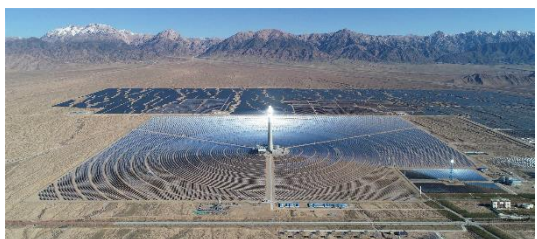
中控太阳能德令哈 50MW 塔式热发电系统