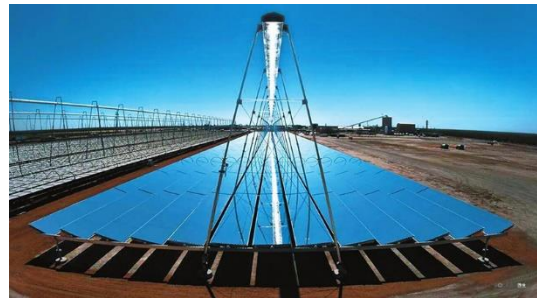
首航高科的线性菲涅尔式光热发电系统